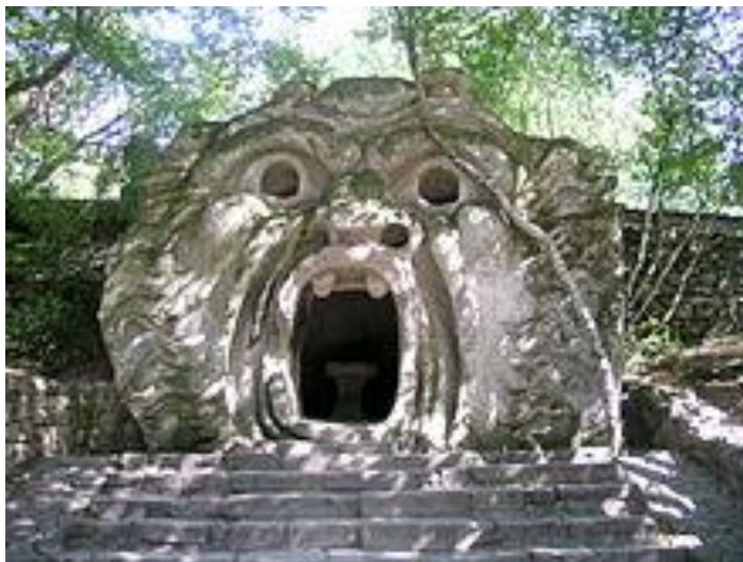
Orco (figura central del Parco dei Mostri)

Víctima de una vida tortuosa, Orsini tiene pesadillas recurrentes y entremezcla lo onírico y lo real, narra la progresiva soledad al envejecer y el empeño obsesivo en plasmar sus múltiples pesadillas en las rocas de su bosque, en Bomarzo, en un lugar conocido como el Bosque de los Monstruos.